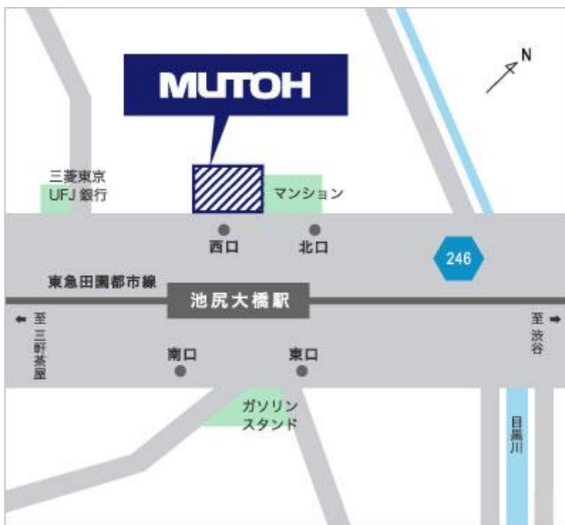
東急田園都市線「池尻大橋」駅 西口出口直結(階段上がり地上部入口)