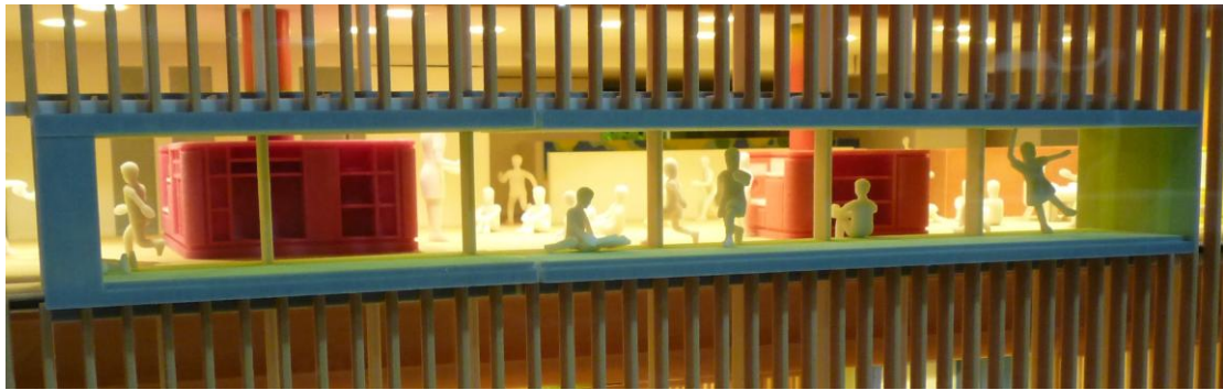
<窓越しから見た 4F保育室>