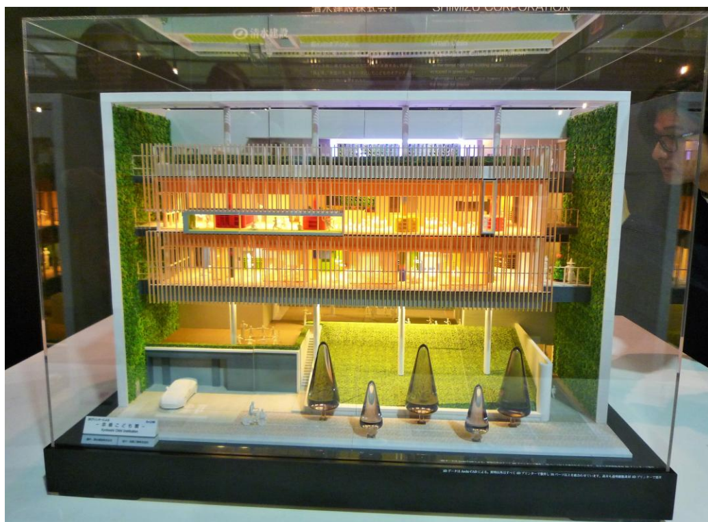
＜立体建築模型「中央区立京橋こども園」外観正面＞

今般展示公開します立体建築模型は、昨年開催された「東京デザインウィーク 2015」の「インタラクティブ建築模型展」への出展のために、1/40 スケールで建物一棟まるまる、全て3Dプリンタで製作した作品で、横幅 940 mm × 奥行 670 mm × 高さ 600 mm、総重量約 100 kg の大型立体建築模型です。35 以上のパーツで構成されており、各パーツも石膏3Dプリンタで表現できる限界に近い精密かつ詳細なモデルです。フルカラー3Dプリンタで製作した建築物単体作品としては、世界最大級の大きさを誇るものです。