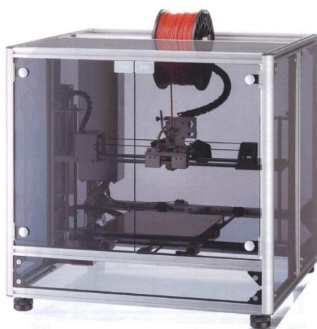
「Value 3D MagiX MF-1100」外観(パネルカラーが「ブラック」になります)

MUTOHホールディングス傘下で、設計・製図機器や CAD ソリューション事業を展開している株式会社ムトーエンジニアリング(本社:世田谷区、社長:阿部要一、以下:ムトーエンジニアリング)は、自社で製造・開発したパーソナル3Dプリンタ「Value 3D MagiX (バリュー スリーディ マジック) シリーズ」に、新たに開発した自社製新ヘッドを搭載した「MF-1100」ならびに簡易3Dソフトをバンドル(同梱)した「MF-1150」を新たにラインアップし、2015年1月19日(月)より販売を開始いたします。