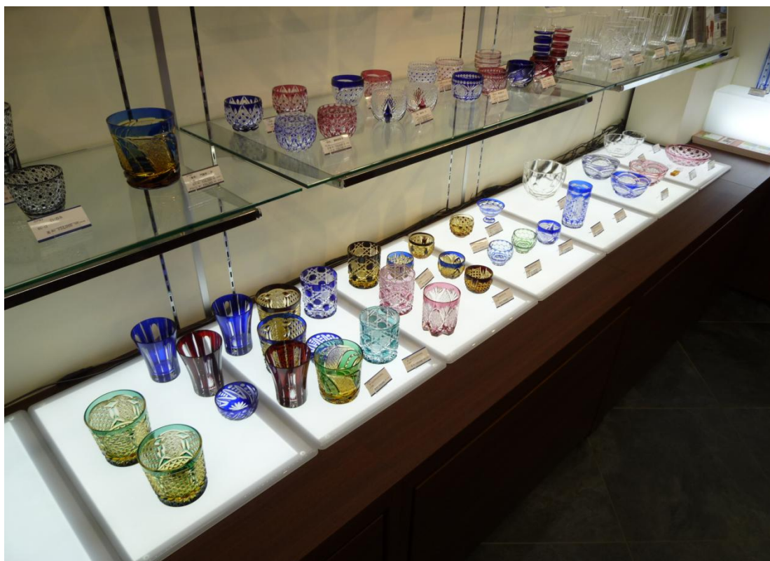
江戸切子展示ご使用例(ご協力:江戸切子協同組合様、亀戸梅屋敷ショールーム様)

LitaVi(リタヴィ)ライトボードMLTシリーズは、独自開発のインクジェットプリンタ技術によるグラデーション印刷を応用した、LED照明向け導光板を用いたトレースボードとして、2012年に販売を開始して以降、均一性の高い発光と発熱が少ないことからイラストレーターや漫画家を目指す専門学校生をはじめ、商品展示用照明台、さらには、塗装工程や医療用機器(カテーテルなど)、精密機械部品の最終検査工程などで利用されています。