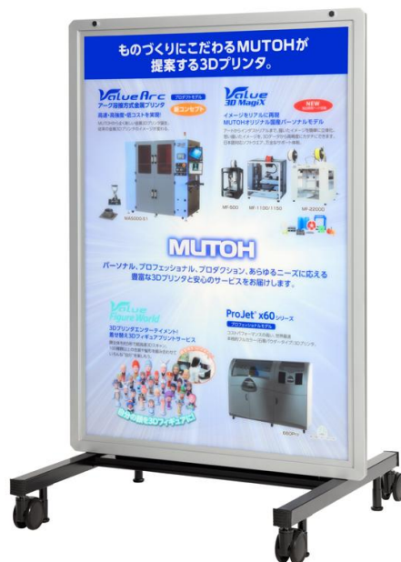
防滴仕様屋外用 LED 看板(1,553mm×1,127mm サイズ)

今回発売を開始した大型 LED 看板は、独自のインクジェットプリンタ技術とインクをベースに B0 サイズを超える導光板印刷装置により製造した導光板と LED 光源を使った薄型防滴仕様屋外用大型 LED 看板で、既に鉄道の駅構内看板として設置することを前提に受注・納入活動を開始いたしました。