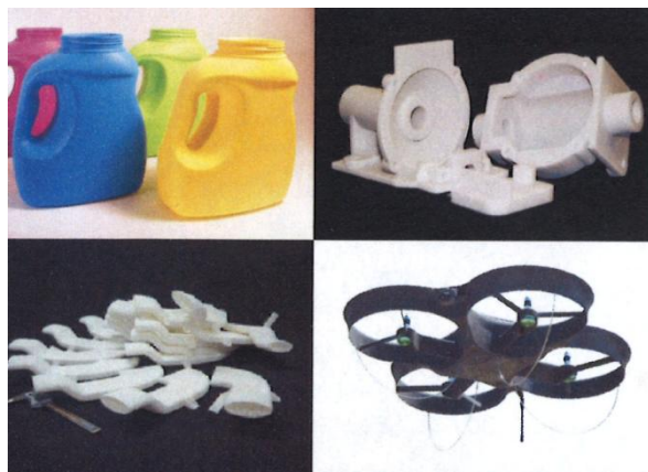
粉末焼結(SLS®)3Dプリンタ出力例