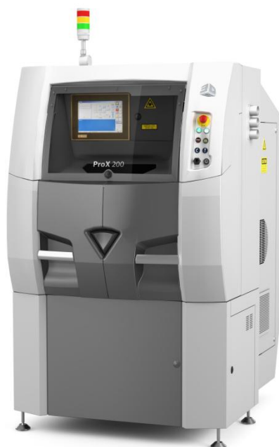
“ダイレクトメタル3Dプリンタ”『ProX200』 販売予定価格は¥59,800,000(本体価格)

今般、新たに展示デモンストレーションを行いますプロフェッショナル向けプロダクション3Dプリンタは以下の2機種です。