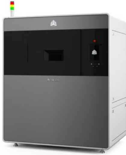
“粉末焼結(SLS®)3Dプリンタ”『ProX500』 販売予定価格は¥40,900,000(本体価格)